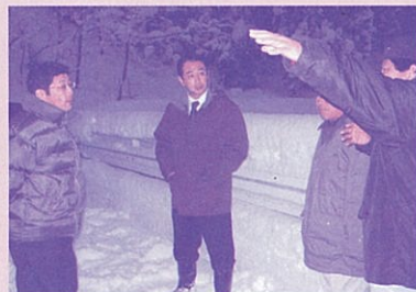
※1月21日には東京にも雪が降り、国会周辺も真っ白な雪景色となりました。