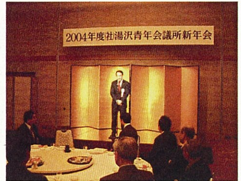
各種団体の会議・懇親会にもお声がけいただき ありがとうございます