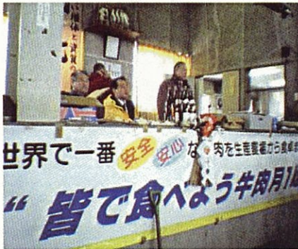
地元の行事にも積極的に参加しています (大曲家畜市場初セリ)