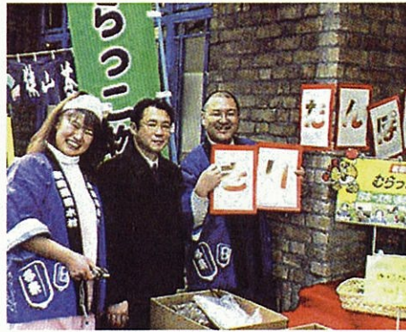
「秋田を売り込め！」秋田の物産展のお手伝いを しました (東京都内のスーパーマーケット前)