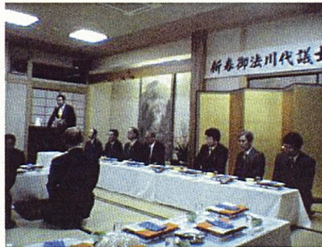
各地区後援会の総会等にも出席させていただいて います (稲川町後援会総会)