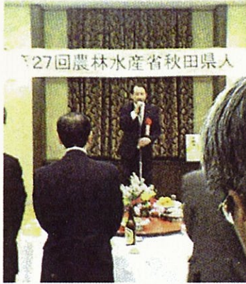
農林水産省秋田県人会に出席 (東京都内)