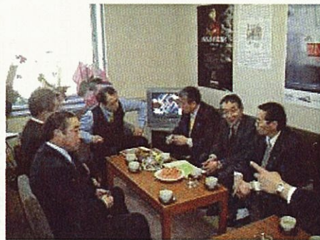
地元の皆様の声を伺うのも大事な仕事です (議員会館事務所)