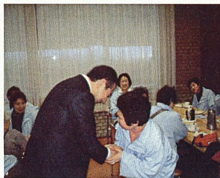
地元からいろいろな方々が訪ねてくださいます (議員会館内食堂)