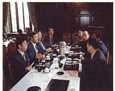
訪ねてくださった地元の方々と食事中 (衆議院内食堂)