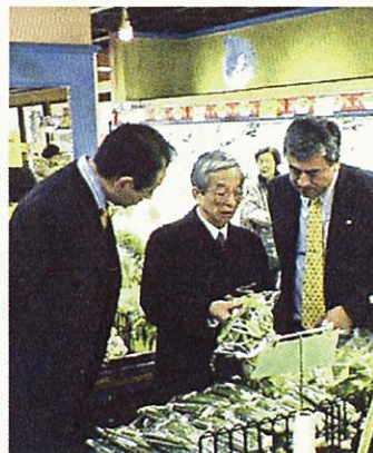
秋田産の野菜の流通調査もします (東京都内のスーパーマーケット)