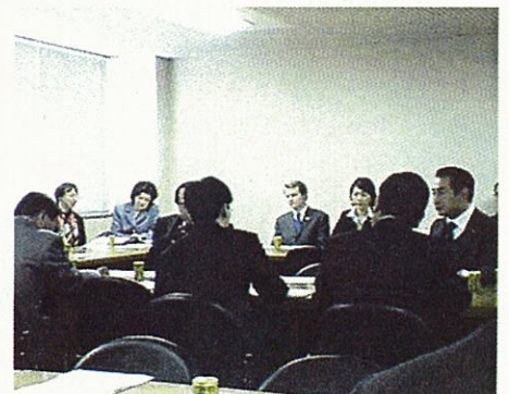
「日本・カナダ友好議員連盟」の勉強会に参加 一年生議員にとって毎日勉強は欠かせません