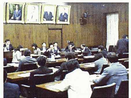
所属委員会に出席し様々な案件を協議します (衆議院内)