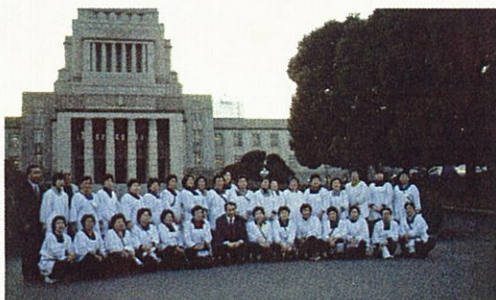
国会見学にいっしょの方々のご案内をさせていただきます 皆様もおいでください(国会議事堂前)