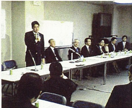
「新世紀の安全保障体制を確立する若手議員の会」設立総会に出席 (議員会館)